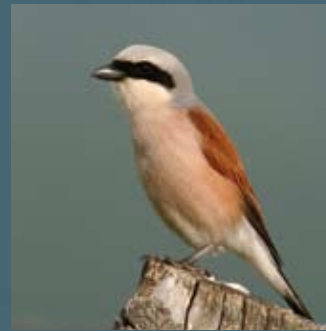
Averla Piccola

martedì 1 mercoledì 2 giovedì 3 venerdì 4 sabato 5 domenica 6 lunedì 7 martedì 8 mercoledì 9 giovedì 10 venerdì 11 sabato 12 domenica 13 lunedì 14 martedì 15 mercoledì 16 giovedì 17 venerdì 18 sabato 19 domenica 20 lunedì 21 martedì 22 mercoledì 23 giovedì 24 venerdì 25 sabato 26 domenica 27 lunedì 28 martedì 29 mercoledì 30 giovedì 31