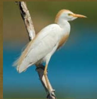
Airone Guardabuoi

lunedì 1 martedì 2 mercoledì 3 giovedì 4 venerdì 5 sabato 6 domenica 7 lunedì 8 martedì 9 mercoledì 10 giovedì 11 venerdì 12 sabato 13 domenica 14 lunedì 15 martedì 16 mercoledì 17 giovedì 18 venerdì 19 sabato 20 domenica 21 lunedì 22 martedì 23 mercoledì 24 giovedì 25 venerdì 26 sabato 27 domenica 28 lunedì 29 martedì 30 mercoledì 31